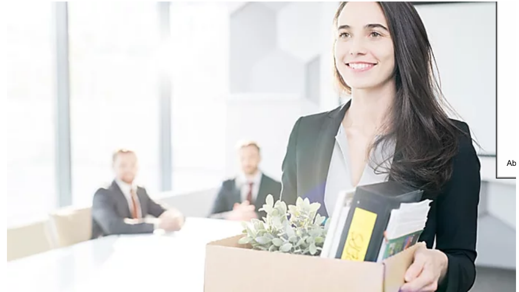
Job in Gefahr

Diese Smartwatch erregt überall Aufsehen. Sie kostet? Fast nichts!