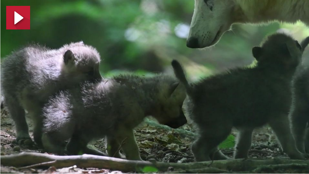
Sensation im Zoo Stralsund Erste Polarwolf-Babys seit 13 Jahren