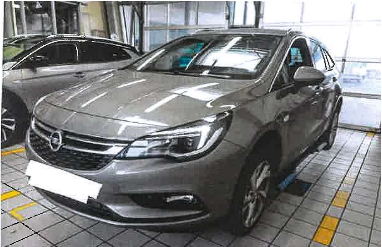
Das Unfallfahrzeug, ein Opel Astra Sports Tourer