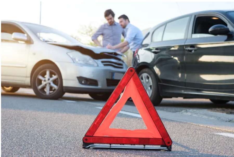
Tricks der Kfz-Versicherungen

Pressemitteilung • Mär 09, 2020 11:30 CET