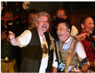
Thomas Gottschalk singt auf dem Oktoberfest