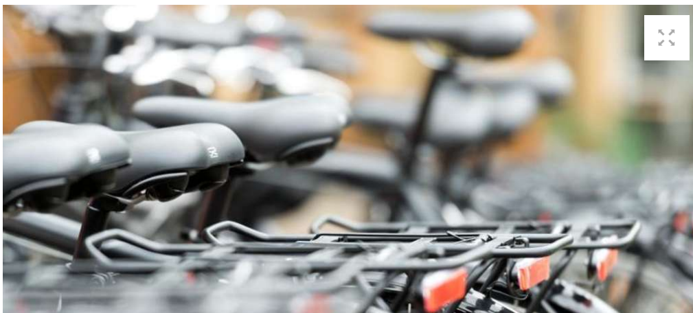
Fahrräder, aber auch die neuen E-Tretroller dürfen an ihrem Abstellplatz andere Verkehrsteilnehmer nicht behindern.