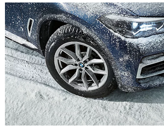
Meistern Schnee und Eis. Original BMW Winterkomplettreder.