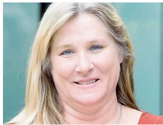
Asthma-Test: Asthma hat viele Gesichter. Wie schwer ist Ihr Asthma?