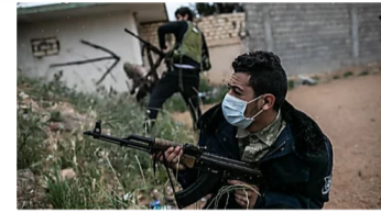
Libyen Der Corona-Krieg

Baumärkte in der Coronakrise Der zweifelhafte Ansturm auf Kabel und Farben Nachdem sie in den vergangenen Tagen überrannt wurden, schließen immer mehr Baumärkte nun ihre Türen. Doch wo und für wen bleiben sie noch geöffnet? Und warum muss vielerorts sogar die Polizei draußen bleiben?