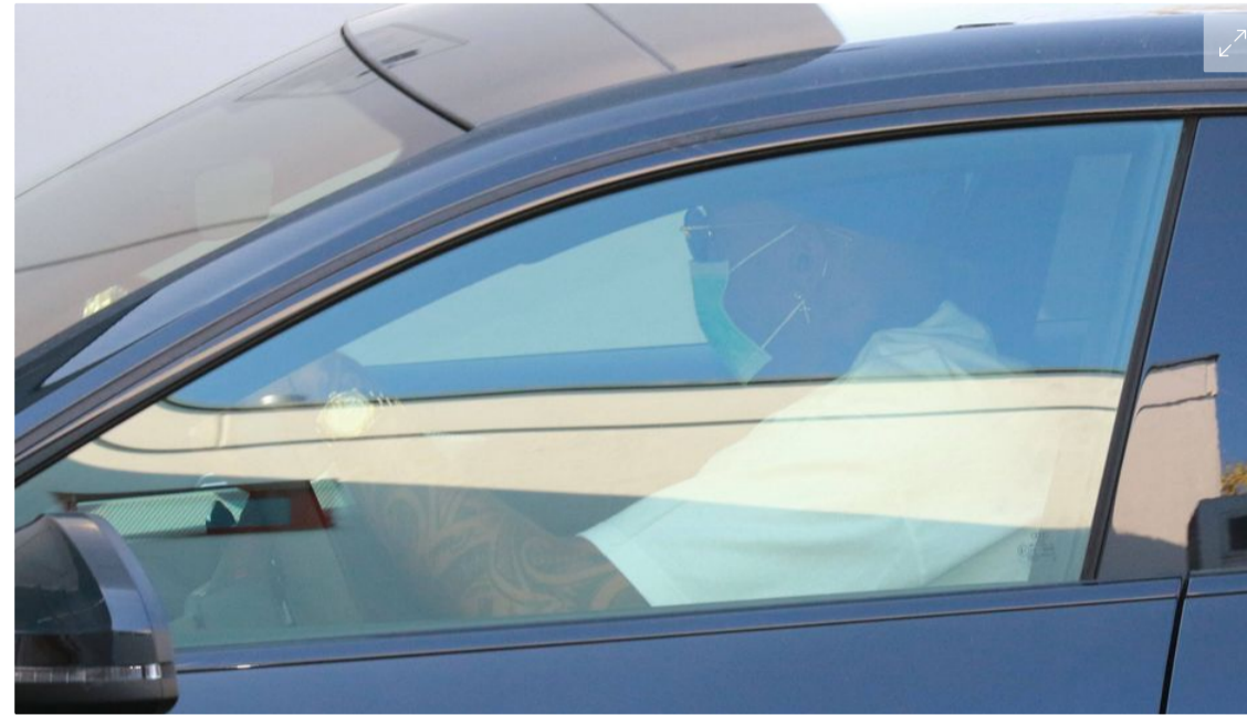
Immer mehr Menschen tragen Mundschutz - manche, wie Fußballprofi Jérôme Boateng, sogar am Steuer.

Egal ob gekauft oder selbst genäht: Wegen der Corona-Epidemie setzen immer mehr Menschen einen Mundschutz auf. Wer den auch am Steuer eines Autos tragen will, muss aber darauf achten, dass er für andere noch klar erkennbar bleibt.